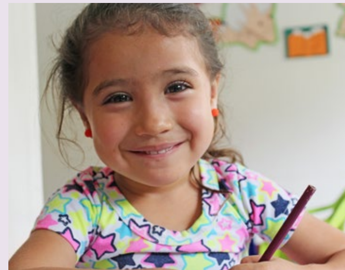
Dieses Bild stammt aus der weltweiten Programmarbeit der SOS-Kinderdörfer und dient zur Veranschaulichung des Kindertageszentrums in Spanien.